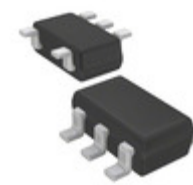
ADG702BRJZ-REEL Analog Devices Inc. IC SWITCH SPST SOT23-5