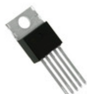
MCP1825-5002E/AT Microchip Technology IC REG LDO 5V 0.5A TO220-5