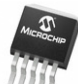
MCP1825-5002E/ET Microchip Technology IC REG LDO 5V 0.5A DDPAK