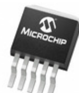
MCP1825-3302E/ET Microchip Technology IC REG LDO 3.3V 0.5A DDPAK