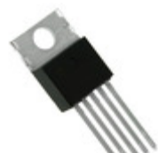
MCP1825-3302E/AT Microchip Technology IC REG LDO 3.3V 0.5A TO220-5