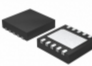
MCP4652T-104E/MF Microchip Technology IC DGTL POT 100K 257TAPS 10-DFN