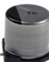
EEV-TG2A220P Panasonic Electronic Components CAP ALUM 22UF 20% 100V SMD