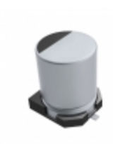
EEV106M025S9BAA KEMET ALU ELECTROLYTIC SMD EEV 25VDC 4