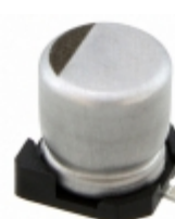
EEV106M035A9DAA KEMET CAP ALUM 10UF 20% 35V SMD