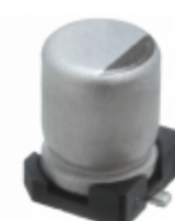
EEV106M025A9BAA KEMET CAP ALUM 10UF 20% 25V SMD