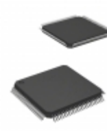
ATSAM3SD8CA-AU Microchip Technology IC MCU 32BIT 512KB FLASH 100LQFP