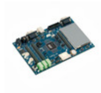
ATSAM3U-EK Micrel / Microchip Technology KIT EVAL FOR AT91SAM3U CORTEX