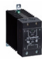
CMRD6055 Crydom Co. RELAY SSR SCR 55A 660V PNL MNT