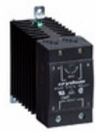
CMRD6065 Crydom Co. RELAY SSR SCR 65A 660V PNL MNT