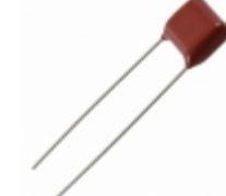
ECQ-E6273JF3 Panasonic Electronic Components CAP FILM 0.027UF 5% 630VDC RAD