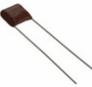
ECQ-E6272JF Panasonic Electronic Components CAP FILM 2700PF 5% 630VDC RADIAL