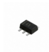
DB6J314K0R Panasonic Electronic Components DIODE ARRAY SCHOTTKY 30V SMINI6