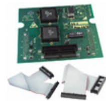
DB66X RF Solutions BOARD DAUGHTER ICEPIC