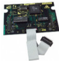
DB62X RF Solutions BOARD DAUGHTER ICEPIC