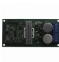
DB64R Apex Microtechnology DEMO BOARD FOR SA306-IHZ