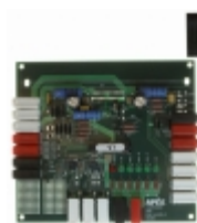
DB62 Apex Microtechnology DEMO BOARD FOR SA305EX