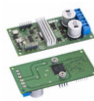
DB63 Apex Microtechnology DEMO BOARD FOR SA57-IHZ