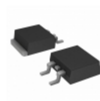
L7808ACD2T STMicroelectronics IC REG LDO 8V 1.5A D2PAK