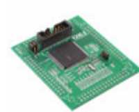
ML610Q439 REFBOARD LAPIS Semiconductor BOARD REF ML610Q439/ML610Q439P