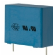
B32914A3105K189 EPCOS (TDK) CAP FILM 1UF 10% 760VDC RADIAL