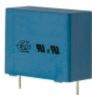
B32914A3105K EPCOS (TDK) CAP FILM 1UF 10% 760VDC RADIAL