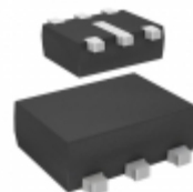
STLQ015XG33R STMicroelectronics IC REG LDO 3.3V 0.15A SOT666