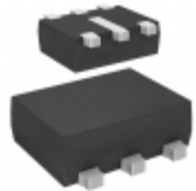
STLQ015XG28R STMicroelectronics IC REG LDO 2.8V 0.15A SOT666