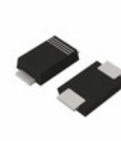
RBR3LAM60BTFTTR LAPIS Semiconductor AUTOMOTIVE SCHOTTKY BARRIER DIOD