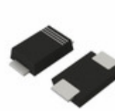
RBR3LAM60BTR LAPIS Semiconductor DIODE SCHOTTKY 60V 3A PMDTM