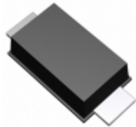
RBR3MM30ATR Rohm Semiconductor DIODE SCHOTTKY 30V 3A PMDU