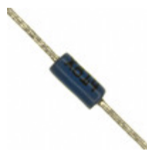
BAT41 STMicroelectronics DIODE SCHOTTKY 100V 100MA DO35