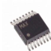
MAX6659MEE+T Maxim Integrated SENSOR TEMP I2C/SMBUS 16QSOP