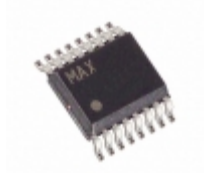
MAX6659MEE+ Maxim Integrated SENSOR TEMP I2C/SMBUS 16QSOP