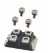
APT75GP120JDQ3 Microsemi Corporation IGBT 1200V 128A 543W SOT227