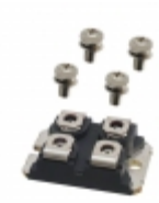
APT75GT120JRDQ3 Microsemi Corporation IGBT 1200V 97A 480W SOT227