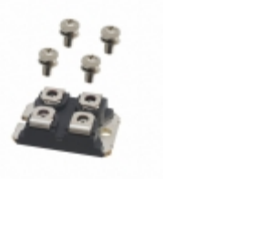
APT75GT120JU3 Microsemi Corporation POWER MOD IGBT 1200V 100A SOT227