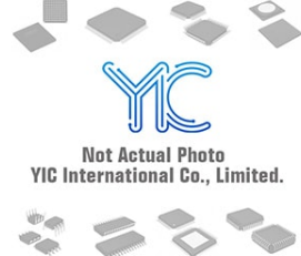
BC856SE6327 INFINEO BC856SE6327 INFINEO