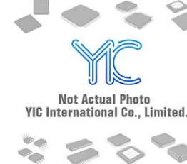
BC856U E6327 Infineo BC856U E6327 Infineo