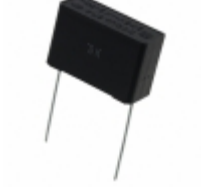
ECQ-UAAF684K Panasonic Electronic Components CAP FILM 0.68UF 10% 275VAC RAD