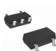
RT9073-23GB Richtek USA Inc. IC REG LDO 2.3V 0.25A SOT23-5