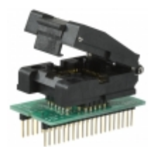
PA51-44Z Logical Systems ADAPTER 44-PLCC ZIF TO 40-DIP