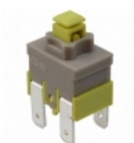
PA512C E-Switch SWITCH PUSHBUTTON DPST 16A 125V