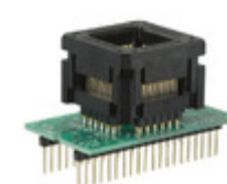
PA51-44 Logical Systems ADAPTER 44-PLCC AE TO 40-DIP