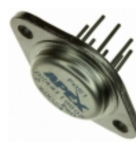
PA51 Apex Microtechnology IC OPAMP POWER 1MHZ TO3-8