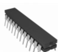
ATF750C-10GM/883 Microchip Technology IC CPLD 10MC 10NS 24CDIP