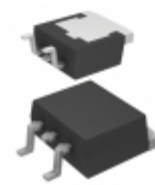
RJK4013DPE-00#J3 Renesas Electronics America MOSFET N-CH 400V 17A LDKPAK