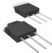
RJK4018DPK-00#T0 Renesas Electronics America MOSFET N-CH 400V 43A TO3P