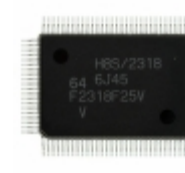
DF2318VF25V Renesas Electronics America IC MCU 16BIT 256KB FLASH 100QFP