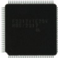
DF2317VTEBL25V Renesas Electronics America IC MCU 16BIT 128KB FLASH 100TQFP