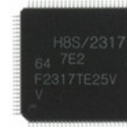
DF2317VTE25V Renesas Electronics America IC MCU 16BIT 128KB FLASH 100TQFP