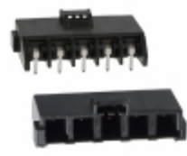
DF22R-5P-7.92DS(05) Hirose Electric Co Ltd CONN HEADER 5POS 7.92MM R/A TIN