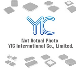
2SA2094 TL Q ROHM 2SA2094 TL Q ROHM