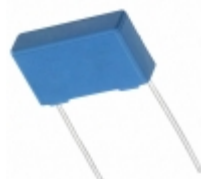
B32922C3223K289 EPCOS (TDK) CAP FILM 0.022UF 10% 305VAC RAD