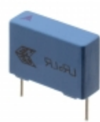
B32922C3154M289 EPCOS (TDK) CAP FILM 0.15UF 20% 305VAC RAD