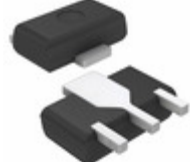
2SB0766GRL Panasonic Electronic Components TRANS PNP 50V 1A MINI-PWR