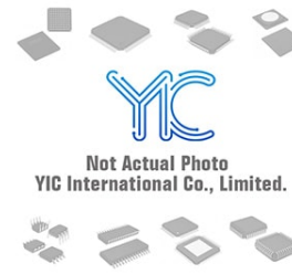
2SB0789 PANASONIC 2SB0789 PANASONIC