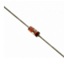
DSB2810 Microsemi Corporation DIODE SCHOTTKY 20V 75MA DO35