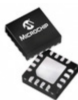
PIC16F1455T-I/JQ Microchip Technology IC MCU 8BIT 14KB FLASH 16UQFN