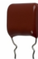
ECQ-P1H124GZW Panasonic Electronic Components CAP FILM 0.12UF 2% 50VDC RADIAL