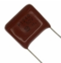
ECQ-P1H124GZ Panasonic Electronic Components CAP FILM 0.12UF 2% 50VDC RADIAL