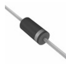
BZW06-256B R0G TSC (Taiwan Semiconductor) TVS DIODE 256V 529V DO204AC