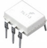
TIL113M AMI Semiconductor / ON Semiconductor OPTOISO 4.17KV DARL W/BASE 6DIP