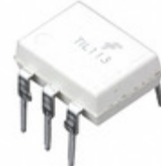
TIL113M Fairchild/ON Semiconductor OPTOISO 4.17KV DARL W/BASE 6DIP