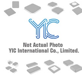
MIC5012BWM MICREL MIC5012BWM MICREL