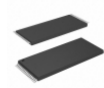
AT28LV010-20TA Microchip Technology IC EEPROM 1MBIT 200NS 32TSOP