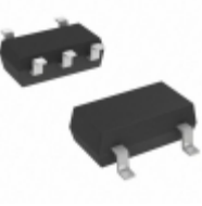
MIC5365-2.9YC5-TR Microchip Technology IC REG LDO 2.9V 0.15A SC70-5