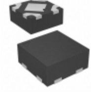
MIC5365-2.8YMT-TZ Microchip Technology IC REG LDO 2.8V 0.15A 4TMLF