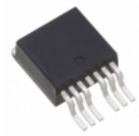
AUIRFS4010-7P Infineon Technologies MOSFET N-CH 100V 190A D2PAK-7P