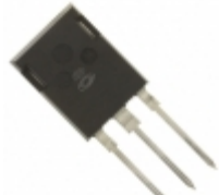
APT22F120B2 Microsemi Corporation MOSFET N-CH 1200V 23A T-MAX