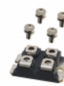
APT21M100J Microsemi Corporation MOSFET N-CH 1000V 21A SOT-227