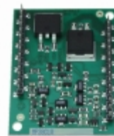
MP38CLA Apex Microtechnology IC OPAMP POWER 2MHZ 30DIP