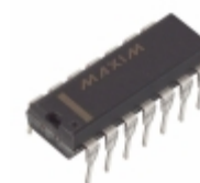
MAX479ACPD Maxim Integrated IC OPAMP GP 85KHZ 14DIP