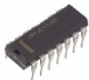
MAX479EPD Maxim Integrated IC OPAMP GP 85KHZ 14DIP