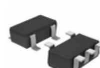
BD45391G-TR Rohm Semiconductor IC RESET OD 3.9V 100MS 5SSOP