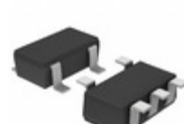
BD45415G-TR Rohm Semiconductor IC RESET OD 4.1V 50MS 5SSOP