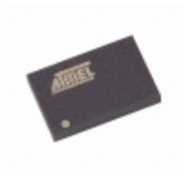
AT45DB041B-CI Microchip Technology IC FLASH 4MBIT 20MHZ 14CBGA