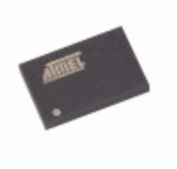
AT45DB041B-CC-2.5 Microchip Technology IC FLASH 4MBIT 15MHZ 14CBGA