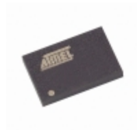
AT45DB041B-CI-2.5 Microchip Technology IC FLASH 4MBIT 15MHZ 14CBGA