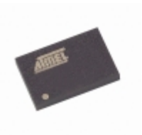
AT45DB041B-CC Microchip Technology IC FLASH 4MBIT 20MHZ 14CBGA