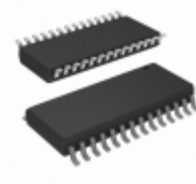
ICL3243ECA Intersil IC TXRX RS-232 3-5.5V ESD 28SSOP