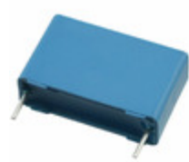
B32923C3474K189 EPCOS (TDK) CAP FILM 0.47UF 20% 305VAC RAD