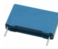
B32923C3334M289 EPCOS (TDK) CAP FILM 0.33UF 20% 305VAC RAD