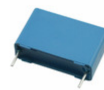
B32923C3474K EPCOS (TDK) B32923C3474K EPCOS (TDK)