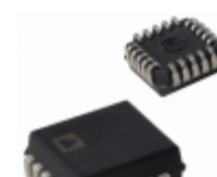
AD670JPZ-REEL7 Analog Devices Inc. IC ADC 8BIT SIGNAL COND 20- PLCC