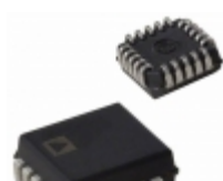
AD670JP Analog Devices Inc. IC ADC 8BIT SGNL COND 20- PLCC