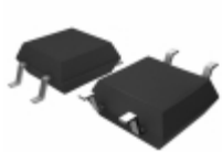
BU4827F-TR Rohm Semiconductor IC VOLT DETECTOR 2.7V SOP4