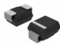
SMAJ70ATR SMC Diode Solutions TVS DIODE 70VWM 113VC SMA