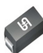
SMAJ70AHR3G TSC (Taiwan Semiconductor) TVS DIODE 70V 113V DO214AC