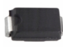
SMAJ70CA-13 Diodes Incorporated TVS DIODE 70VWM 113VC SMA