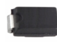
SMAJ70CA-13-F Diodes Incorporated TVS DIODE 70VWM 113VC SMA