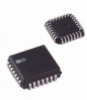
AD698AP Analog Devices Inc. IC LVDT SIGNAL COND 28-PLCC