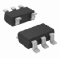
TC2055-2.7VCTTR Microchip Technology IC REG LDO 2.7V 0.1A SOT23-5