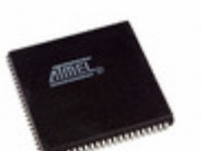
ATF1504ASL-25JI84 Microchip Technology IC CPLD 64MC 25NS 84PLCC