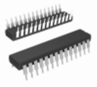
PIC16C73A-20/SP Microchip Technology IC MCU 8BIT 7KB OTP 28SDIP