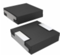
IHLP5050CEER5R6M01 Vishay Dale FIXED IND 5.6UH 9.5A 19 MOHM SMD