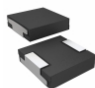
IHLP5050CEER6R8M01 Vishay Dale FIXED IND 6.8UH 9A 22 MOHM SMD